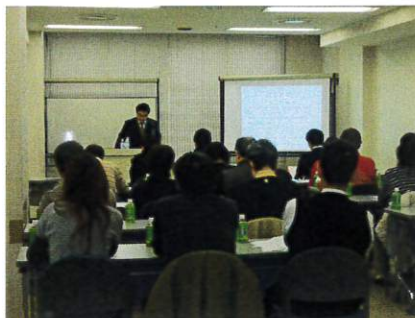
五十嵐社長の講義風景です。