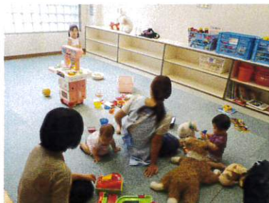
プロのベビーシッターがおりますので 安心してお子様をお預けください。