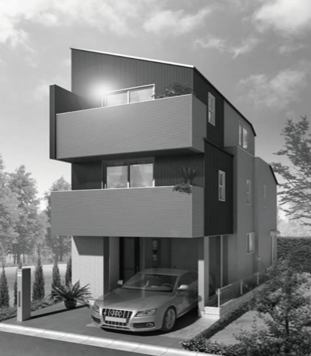
標準仕様で長期優良住宅に対応しております。