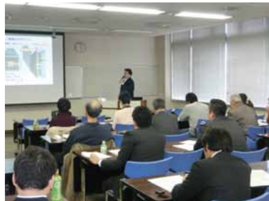
「家づくり無料勉強会」の様子