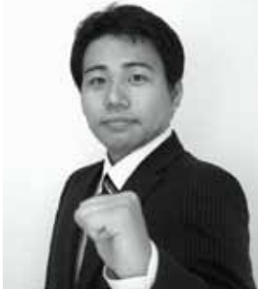
家づくりアドバイザー/二級建築士