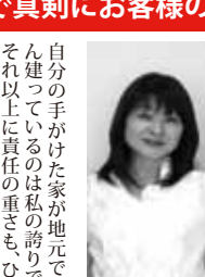
住宅ローンアドバイザー