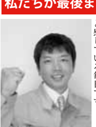
工事部長/一級施工管理技士

家を建てるということ、マンションや建売住宅を買うということは、似ているようで全く異なるものです。自分たちのライフスタイルに合わせて、仕様やデザインにこだわり、快適な空間をつくれるという醍醐味があります。私たちは、皆様に、そんな家づくりのプロセスもきちんと楽しんで欲しいと思います。