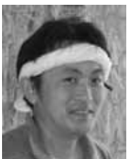
大工/一級施工管理技士