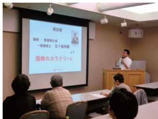
「家づくり無料勉強会」の様子