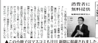
▲この小冊子はマスコミにも注目 新聞に掲載されました。