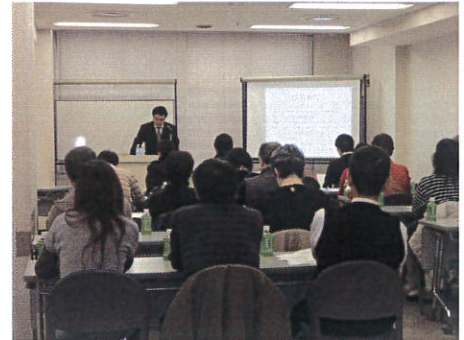
五十嵐社長の講義風景です。