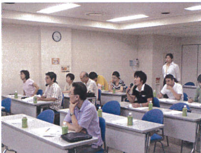
質疑応答の時間もあります。