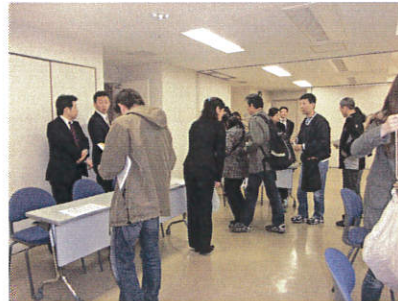
終了後も皆さまからのご質問にお答え致します。