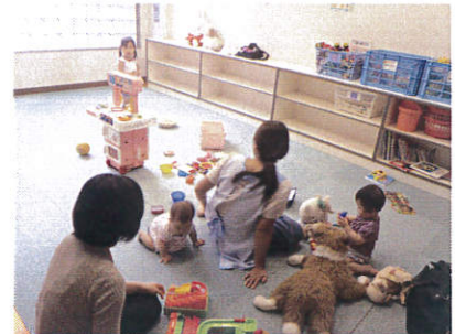
プロのベビーシッターがおりますので安心してお子様をお預けください。