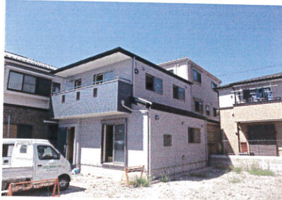
木造2階建て。耐震と断熱の工法が特徴です。