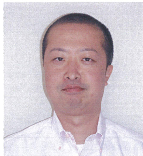
新婚ホヤホヤです♪ 最近、太ってきました… 幸せ太りかな?(笑)