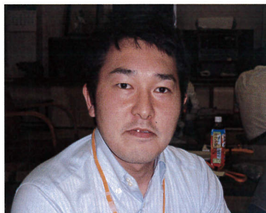
建築材料は任せてください!