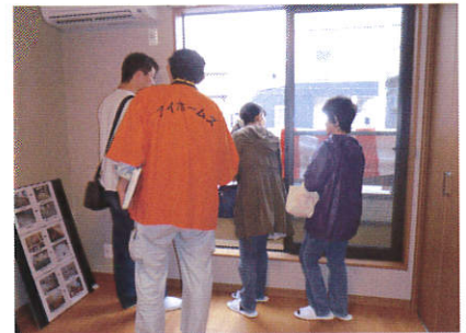
ハウスメーカーとの比較検討されているご家族様