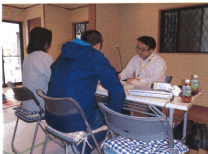
シニア世代のご家族様 建築費用のご相談をされていました。