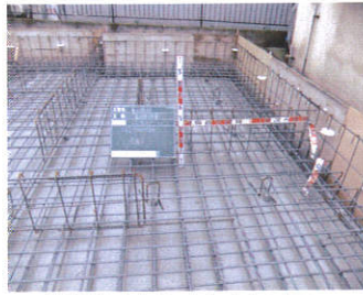
鉄筋検査もらくらくクリア 基礎の大きさも他社と違う！