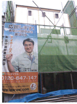
社長のシートが目印です