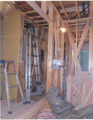
柱・土台は全て4寸の「ひのき」 孫の代まで安心です！

FAXの方は、①住所 ②電話番号 ③参加人数を明記の上、3613-6149まで。