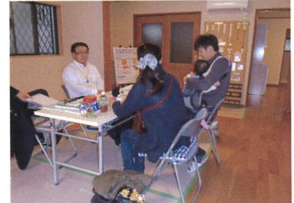
子育て世代のご家族様 家づくりの不安や資金のことを相談されていました。