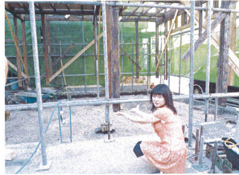
家を持ち上げて古い基礎は撤去