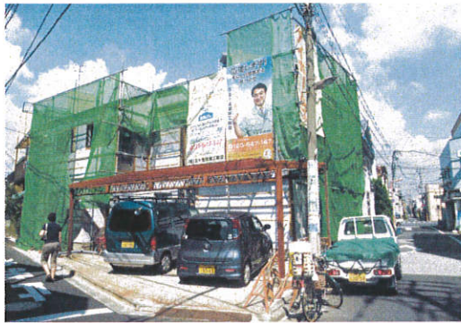
耐震リフォーム全景

FAXの方は、①住所 ②電話番号 ③参加人数を明記の上、3613-6149まで。